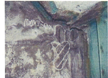
コンクリートの劣化